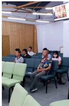
有些弟兄姊妹因疫情仍然 被困中國，兩位東語同學 剛好填補了部分空缺