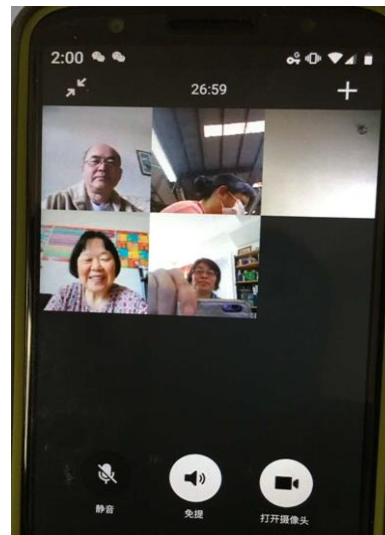
姊妹看完「問得好」的短片後，繼續追求發問信仰的問題。 她們珍惜群組聚會，在上班時也帶著耳機參與，聽取神的話語。