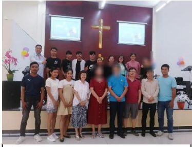
與教會同工及宿舍學生到另一教會參演佈道會的啞劇