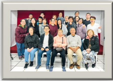
弟兄与古城主恩堂弟兄姊妹合影留念

10 月份有一位短宣来到古城主恩堂与教会配搭事奉，因弟兄是一位物理治疗师，除了在属灵生命上建立弟兄姊妹，也帮助他们在身上的调理。因为教会弟兄姊妹大部份都是经营餐馆，所以身上或多或少都会有一些因长年累月工作而造成的痛楚。感谢主，预备这位弟兄来到古城当中，每晚聚会结束后都帮助弟兄姊妹治疗，也教导弟兄姊妹做一些简单的运动帮助恢复。不但建立弟兄姊妹，也建立教会的年轻人，鼓励他们多依靠神，努力学习圣经，去荣耀神的名。