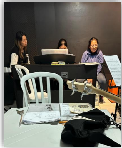
认识到新的朋友，原来是一位已经受洗了的姊妹，父母在巴拉圭，她独自一人来古城读大学。邀请姊妹参加主恩堂教会聚会。