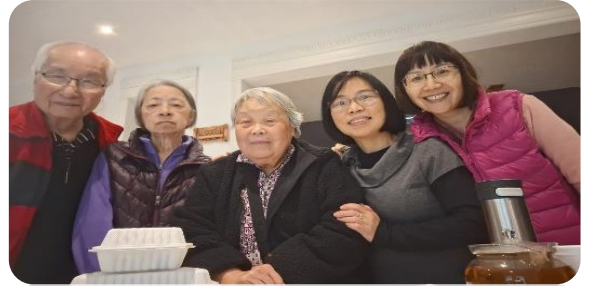
感恩再次與領我決志信主的年長執事見面