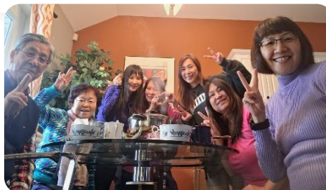
火鍋為寒冷的冬天帶來暖意