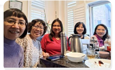
星期五線上青少年團契的老師們