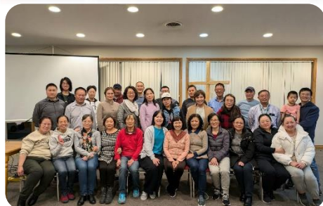
在母會每月的團契分享