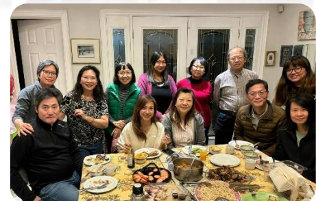
透過不同團契認識不少弟兄姊妹