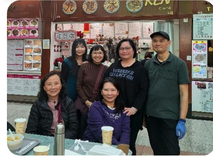
與表妹、表妹夫和主內外朋友相聚