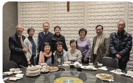
與其中一個支持教會分享後的午餐