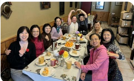
母會教會國語堂部份姊妹們相約早餐