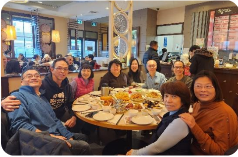
與加神同學喜相逢