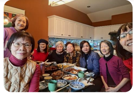
今次述職認識的姊妹們