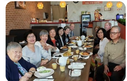
與母會粵語團契的組員晚餐