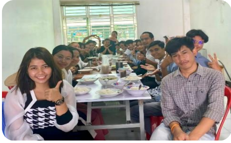
愛之家與信仰之家的聯合崇拜