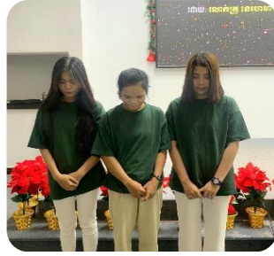
感恩愛之家 3 位女生決志信主