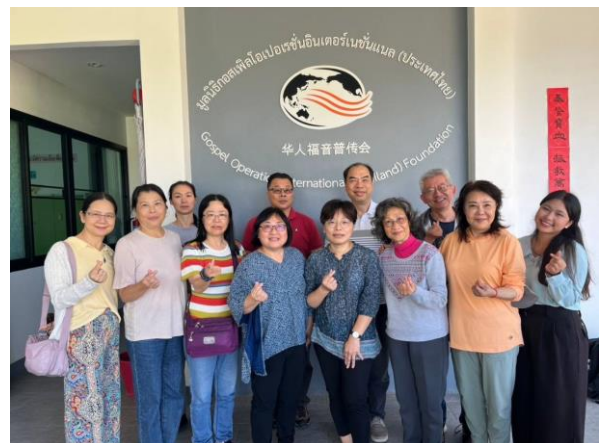
1/22 澳洲辦事處主任鄭牧師帶領短宣隊探訪中心