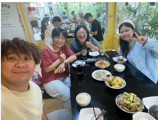
1/29 新春與同工慶祝春節

感謝主，過了一個春節，也跨進了另一個領域，我給自己這三年比喻為曠野之旅，雖然我沒有摩西這麼多的百姓，我只有四個“天兵”(天國精兵)或是六個，但就如摩西帶領以色列人進曠野，會遇見甚麼挑戰?以及遇見甚麼困難?我們都無法預知，但我知道的是必須與神同行，求神讓我敏銳察覺在前面引導的雲柱與火柱，帳幕何時啟程?何時停住?都讓我緊緊跟隨主。