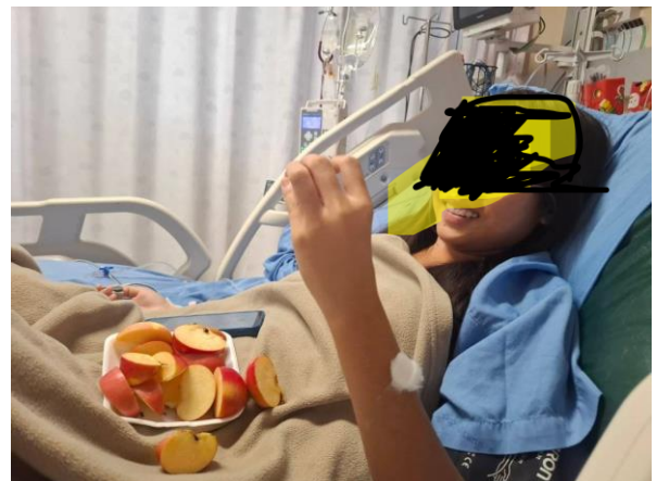
協助一位少女送去醫院急救(細菌感染)